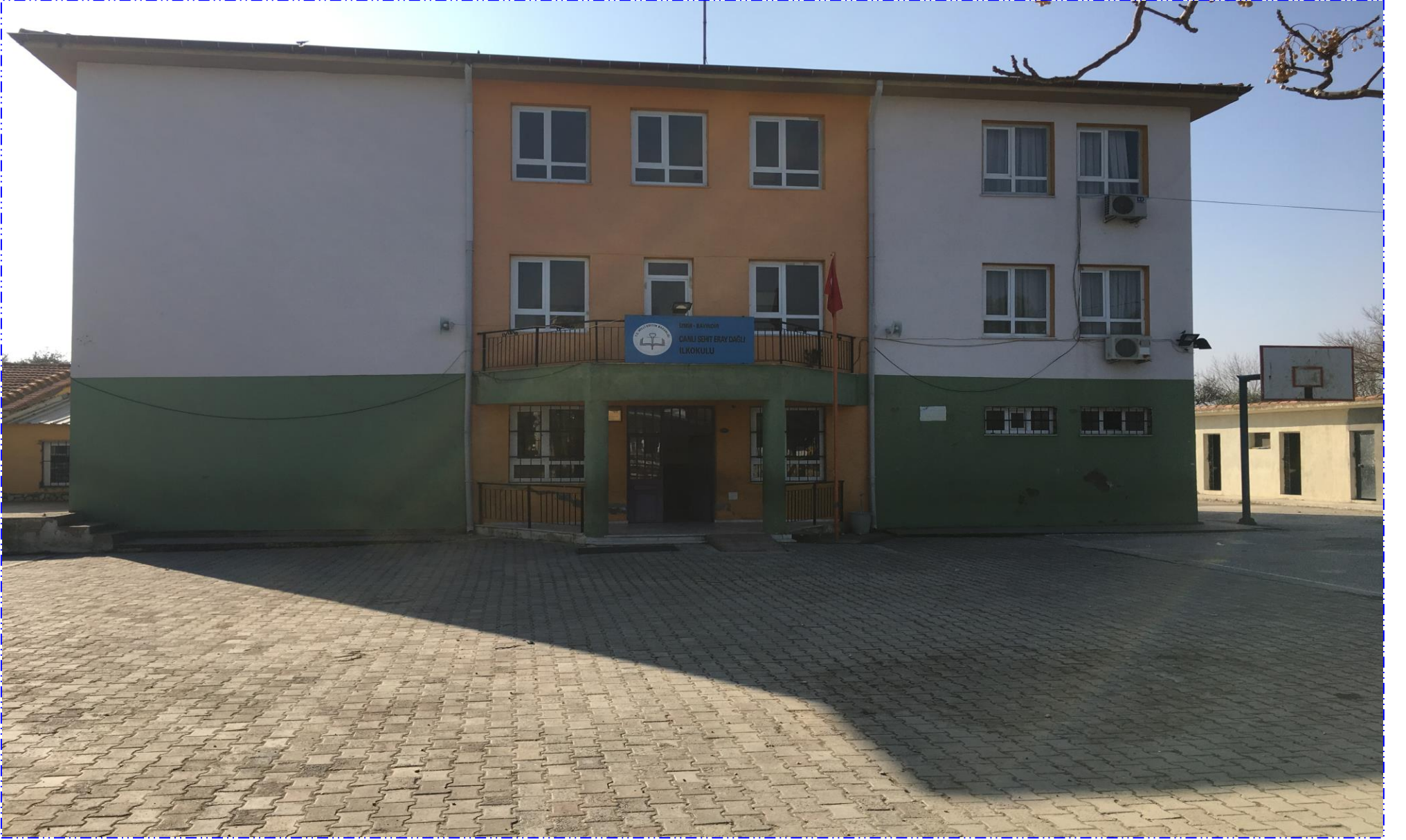
CANLI-ŞEHİT ERAY DAĞLI İLKOKULU